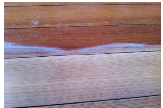
Grobschliff mit Zirkonschleifscheiben KG 36